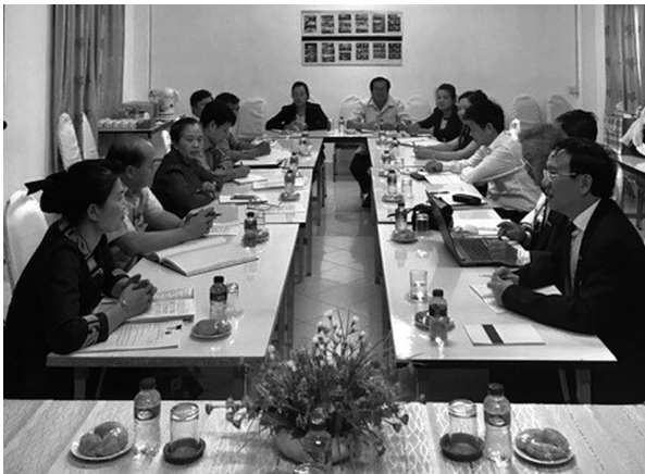
Đoàn làm việc với Trung tâm Da liễu Quốc gia Lào