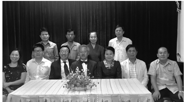
Đoàn làm việc với Lãnh đạo Trung tâm Da liễu Quốc gia Lào

Tiếp đoàn có Thứ trưởng Bộ Y tế Lào và các Lãnh đạo sở có liên quan, Lãnh đạo và các bác sĩ của Trung tâm Da liễu Quốc gia Lào.