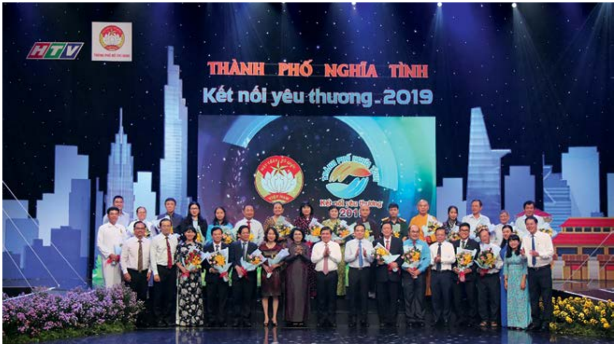
Chương trình “Thành phố nghĩa tình - Kết nối yêu thương” lần thứ 19

trong và ngoài nước trong đó có Tập đoàn Novaland... tích cực triển khai, hỗ trợ trực tiếp các địa phương thông qua chuỗi hoạt động hỗ trợ giáo dục, y tế, an sinh xã hội và phát triển cộng đồng.