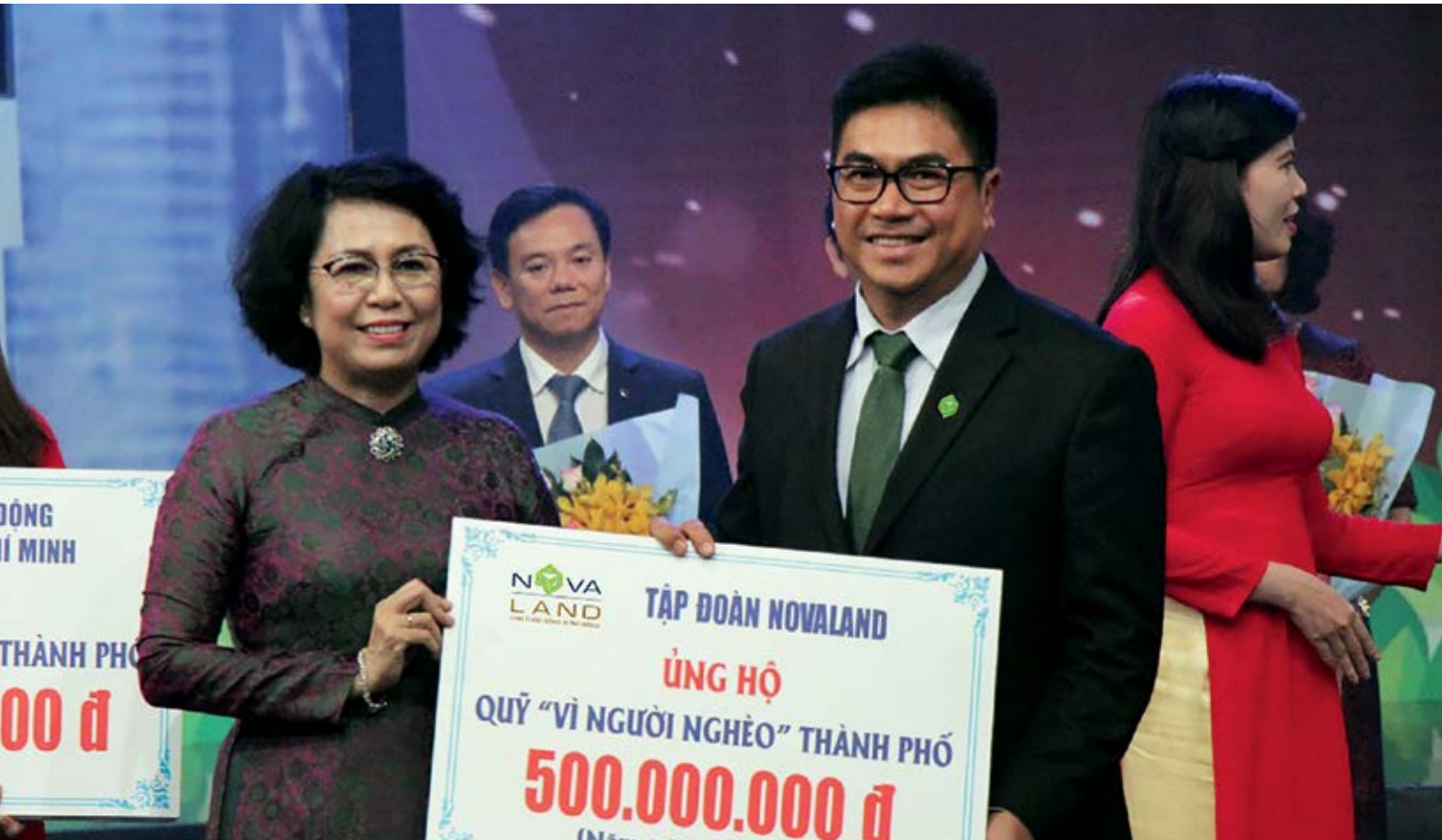
Tập đoàn Novaland 5 năm liên tiếp đồng hành cùng Quỹ Vì người nghèo